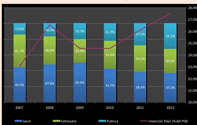
Composición de la Inversión y Tasa como % del PIB