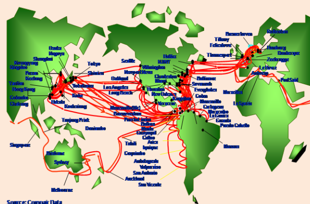
Gráfica N°1 Puertos del Mundo Conectados a través del Canal de Panamá

En el 2011, el Producto Interno Bruto (PIB) del sector de transporte, almacenamiento y comunicaciones se incrementó en 13.7% con respecto al año anterior, representando el 24.1% del total del PIB. Como se muestra en el Grafico N°2 la participación del sector en la producción nacional aumenta cada año, hecho que resalta la importancia del sector para el desarrollo del país.