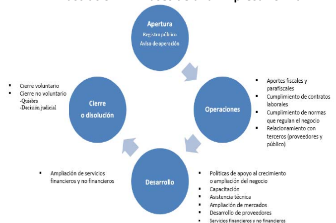
Ilustración N°1 Fases de una Empresa Formal

Existen, como se observa en la ilustración anterior, muchos otros costos que se investigaron en el Programa de Inclusión; no obstante, con el fin de brindar una visión general de la situación que empuja a la informalidad se desarrollaron solo dos de ellas el de apertura y el de operaciones.