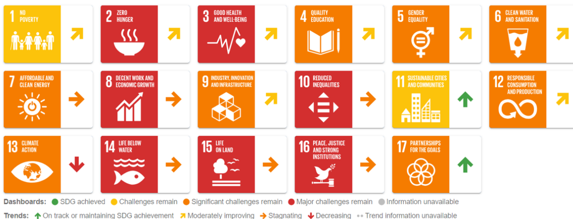
Ilustración N°2 Avances de Panamá en el logro de los ODS, 2023