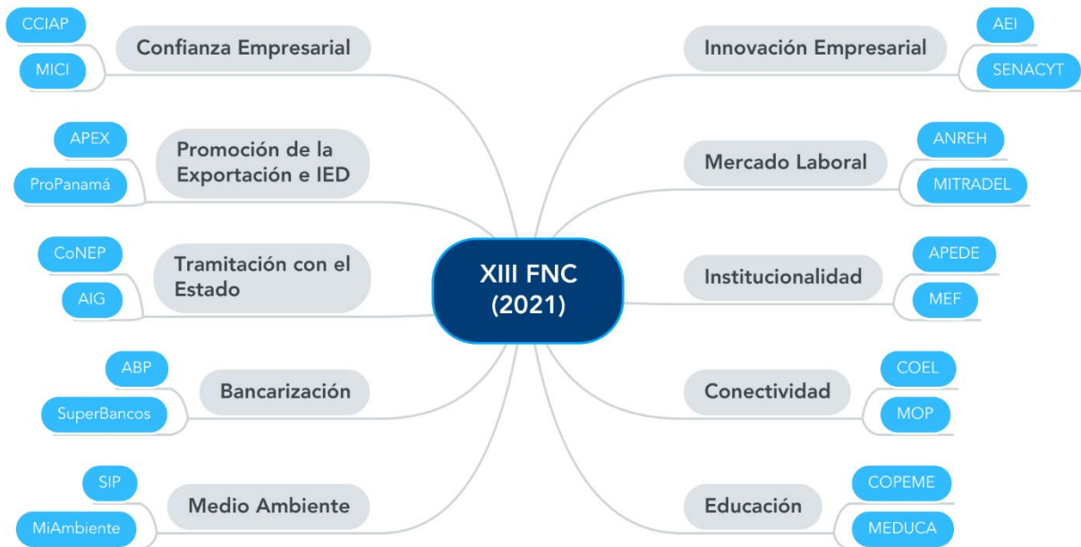
Ilustración 1. Conjunto de actores claves del XIII FNC.