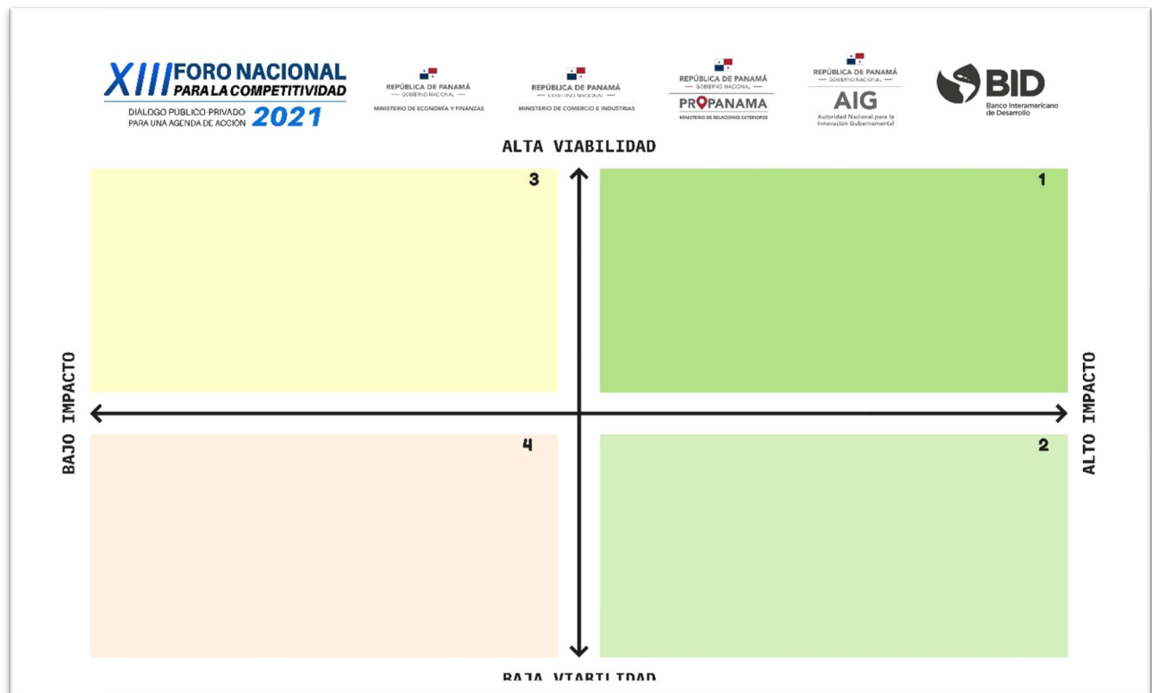
Ilustración 4. Modelo de tablero virtual para clasificación de propuestas.