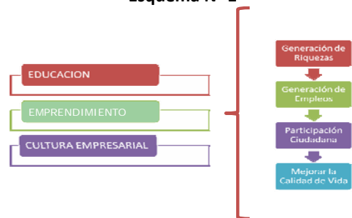
Esquema N° 1

Esta fórmula es la base para cumplir con un principio socio económico real y probado que dice: "La mejor forma de mejorar la distribución del ingreso es con los resultados positivos que de un buen sistema de educación".