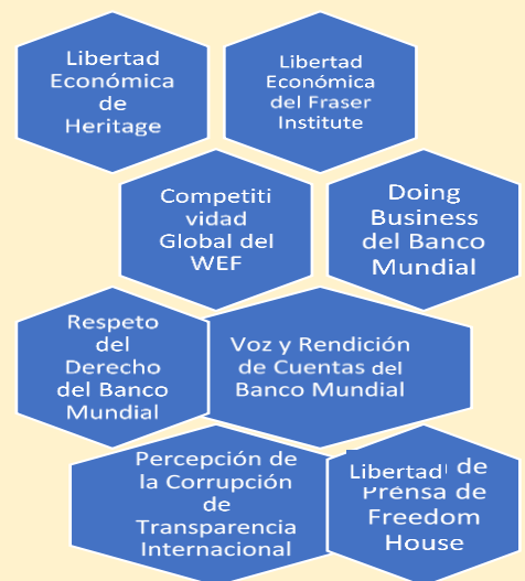
Figura N°1 Composición del ICI

De acuerdo con el informe ICI 2017, existen características que distinguen a las naciones exitosas: gozan de libertad económica para que los emprendedores y los empresarios desplieguen sus sueños y proyectos; crean los mecanismos para que sus empresas sean competitivas; facilitan la creación de empresas en lugar de entorpecer el proceso con regulaciones absurdas. Los países radicados a la cabeza del planeta saben que the rule of law (imperio de la ley) es una de las claves del desarrollo; que la esencia de las relaciones de poder en una República descansa en una práctica saludable: desde el presidente hasta el último funcionario, son servidores públicos que se deben a su población y realizar rendición de cuentas de sus actos; que la corrupción nos cuesta a todos, y que la prensa libre hace tanta falta en cualquier sociedad como factor de información. Todos ellos son rasgos a los que se debe aspirar para mejorar la institucionalidad de las naciones.