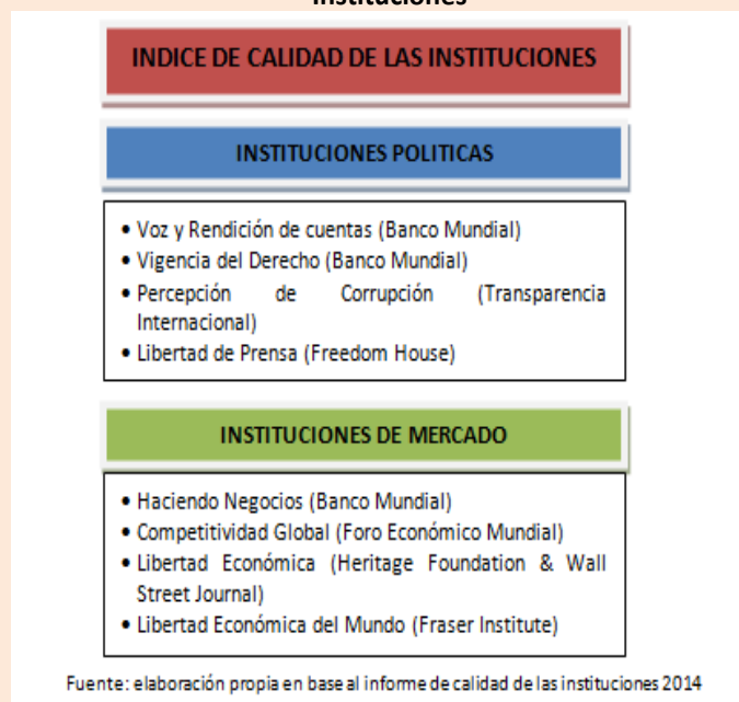
Ilustración N°1 Composición del Índice de Calidad de las Instituciones

El Índice busca evaluar el desempeño de los países, el cual es relativo, porque no se pretende un "óptimo" respecto al cual medir el desempeño de todos los países, simplemente se observa que algunos países obtienen calificaciones superiores en los indicadores seleccionados y se ordenan de mejor a peor pero sin pretender afirmar que el que ocupa el primer lugar posee la calidad institucional perfecta.