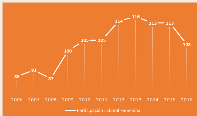
Gráfica 1. Evolución del Indicador Participación Laboral Femenina 2006-2016

Dicho lo anterior, el indicador en Panamá ha ido evolucionando de forma negativa: para el 2008 ocupaba la posición 87 llegando a retroceder 29 posiciones hasta llegar a la posición 116 en el 2013. Esta tendencia cambió de forma positiva escalando 13 posiciones lo que nos ubica en el año 2016 en la posición 103 de 138 economías, como muestra la Gráfica 1.